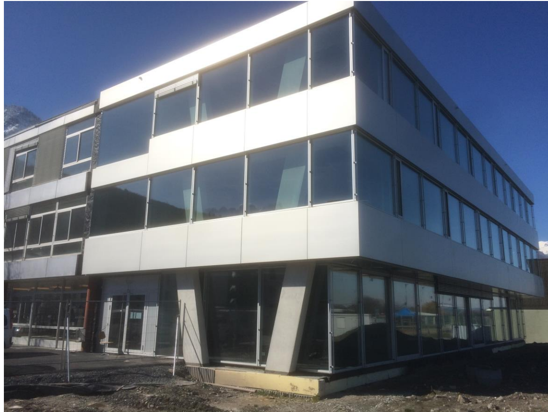
Ecole primaire des Perraires – extension Est

Relevons également l'engagement énergétique communal qui a obtenu le label « Cité de l'Energie » en 2015. Dans cette dynamique, la Maison de Commune (bâtiment administratif) et l'école du Corbier ont été raccordés au chauffage à distance.