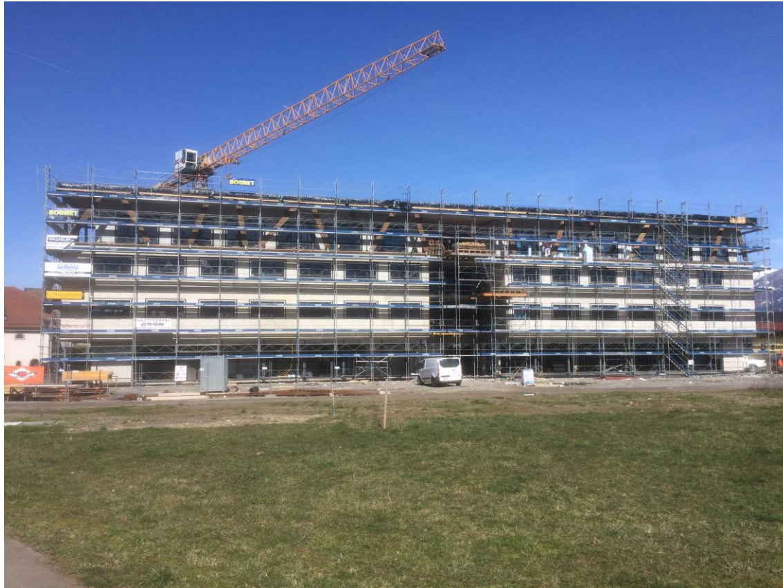
Quartier du Verger – Maison de la Santé en construction