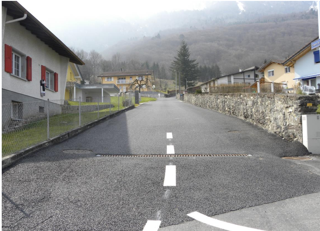
Chemin du Noiret - Muraz