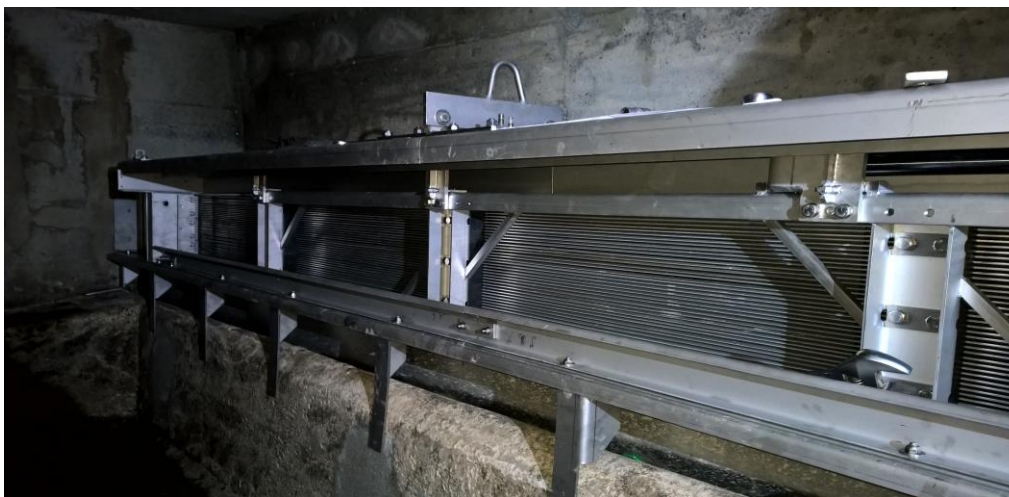
Dégrilleur – déversoir d'orage de la Barme