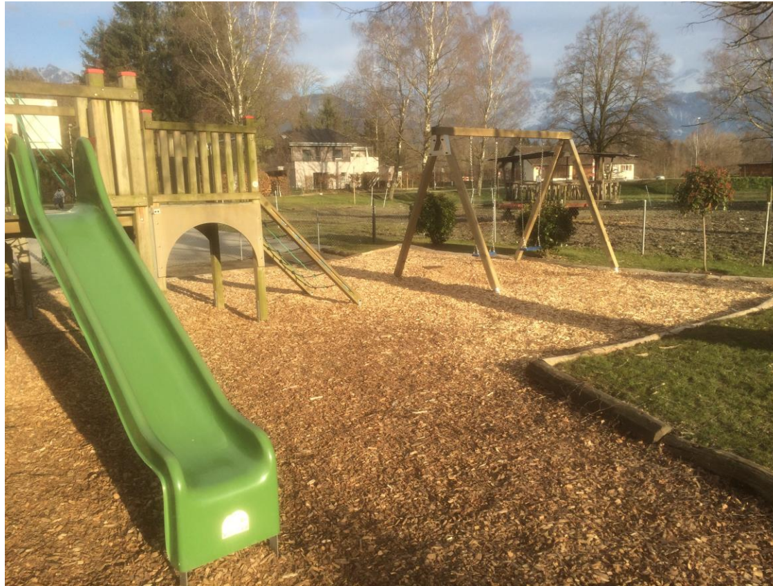
Place de jeux d'Illarsaz

Le Conseil Municipal a décidé de compléter l'équipement existant à la place de jeux située à proximité de l'école d'Illarsaz. Une extension de la zone protégée a été réalisée et une nouvelle balançoire double a été posée.