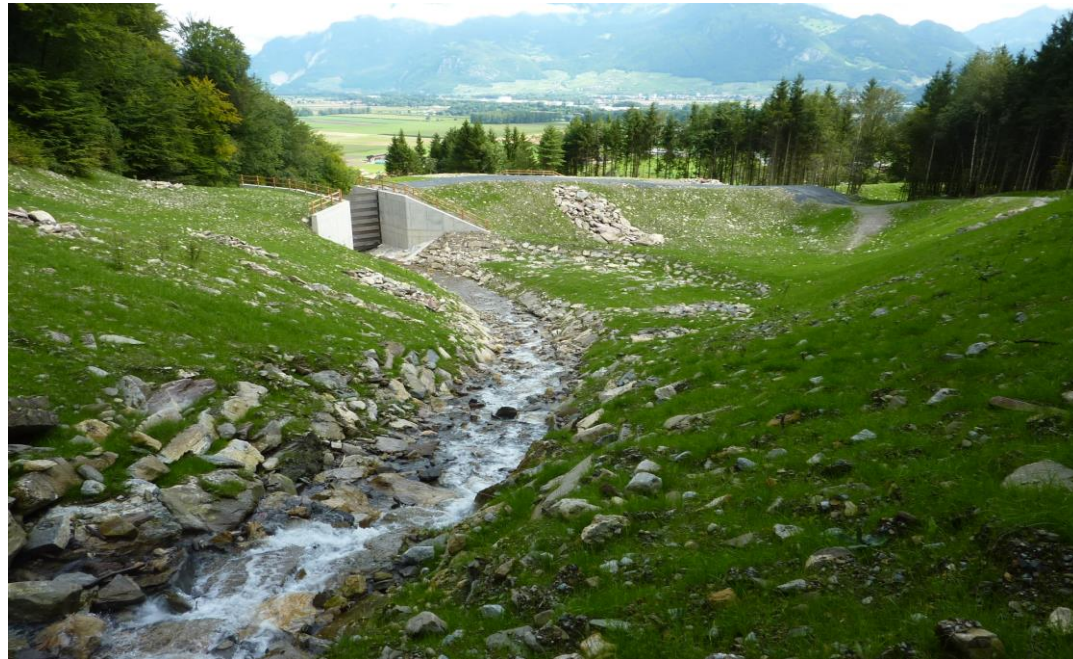
Ouvrage de protection – torrents des Glariers à Muraz