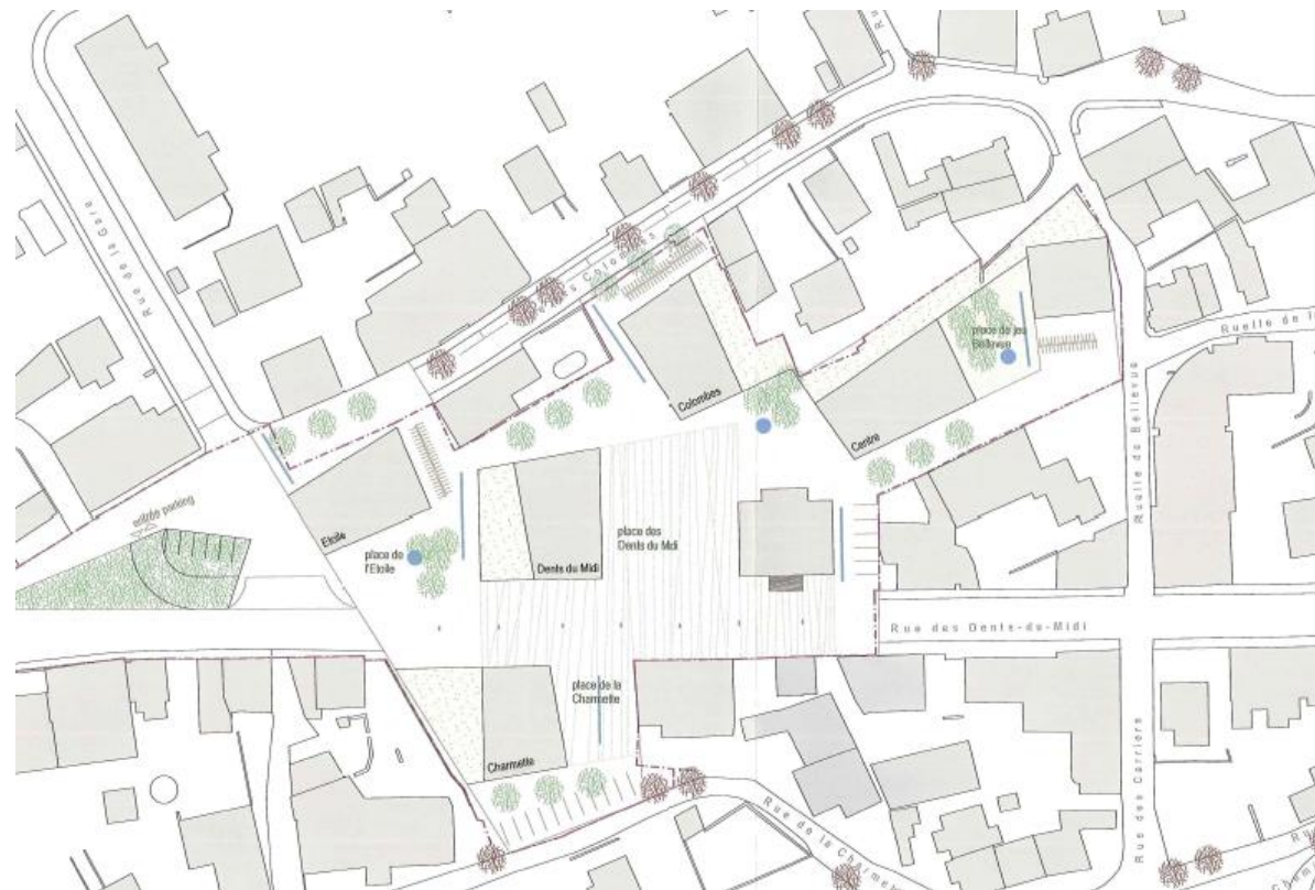
Illustration du projet

Ce règlement a d'ores et déjà été soumis au canton afin de recueillir les différents préavis des services compétents et sera mis à l'enquête publique en 2016.